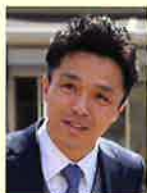
社会福祉法人 高志会